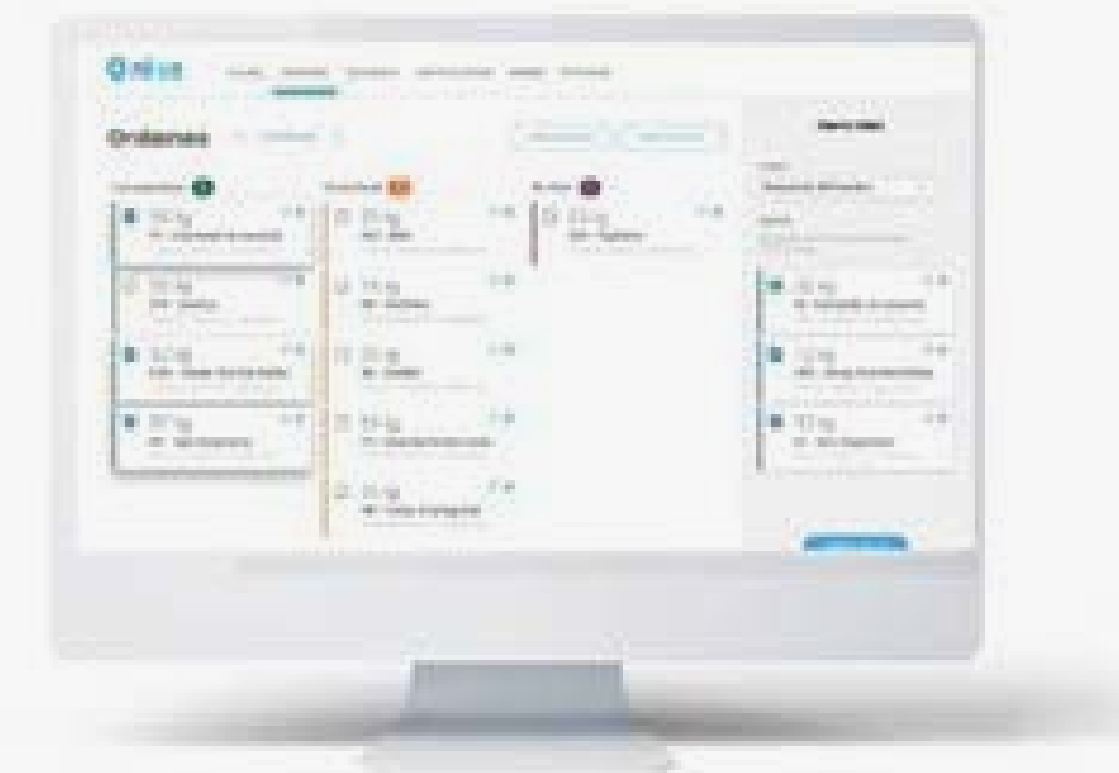
Tablero de control web